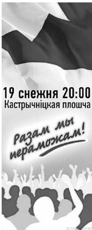
Мал. 1. Аватар з заклікам выйсці на Плошчу 19 снежня. Актыўна распаўсюджваўся ў сацыяльнай сетцы vkontakte.ru

Не засталася па-за ўвагай прэзідэнцкая кампанія і ў сацыяльных сетках. Так, на рэсурсе vkontakte.ru можна вылучыць тры асноўныя інфармацыйныя суполкі выбарчай тэматыкі: «Выбары 2010. Беларусь» 8 ; «Выборы 2010: in-by.net (приложение, биографии, программы и пр.)» 9 і «Президентские выборы 2010 (Беларусь). Экзит-пул. ЗА КОГО ГОЛОСОВАЛИ ВЫ?» 10 . Акрамя таго, на гэтым жа рэсурсе была створана суполка 11 з заклікам сабрацца на Кастрычніцкай плошчы ўвечары 19 снежня (мал. 1).