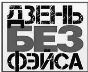
Мал. 2. Аватар ініцыятывы Дзень без фэйса

Дата 19 снежня была яшчэ адзначана ініцыятывай, ідэя якой была агучана загадзя – т. зв. акцыя Дзень без фэйса . Карыстальнікам сацыяльнай сеткі facebook прапаноўвалася замяніць свае профільныя выявы («аватары», «юзэрпікі») на малюнак (мал. 2).